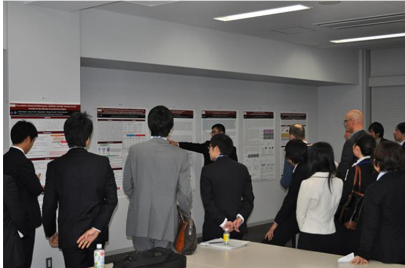
写真 2. GCOE プログラム登録学生によるポスター発表の様子