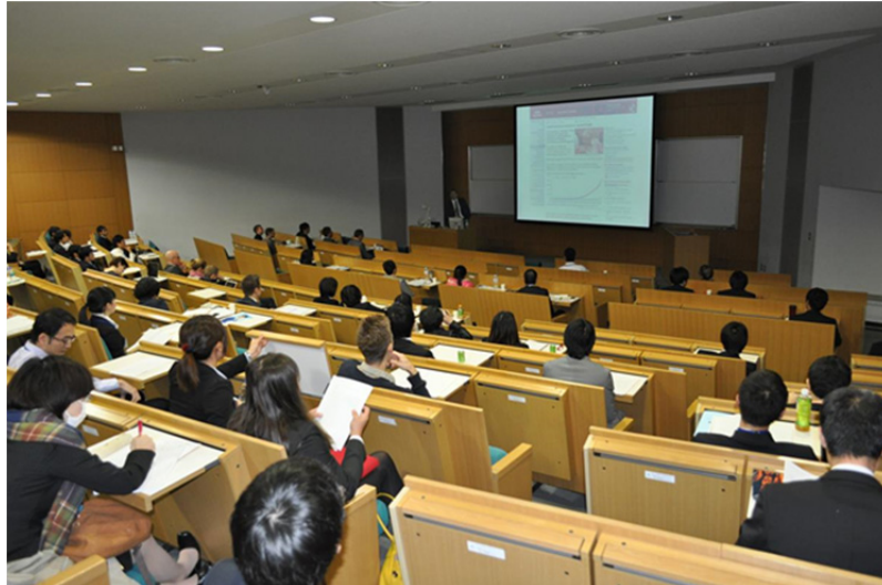
写真 1. シンポジストによる発表の様子