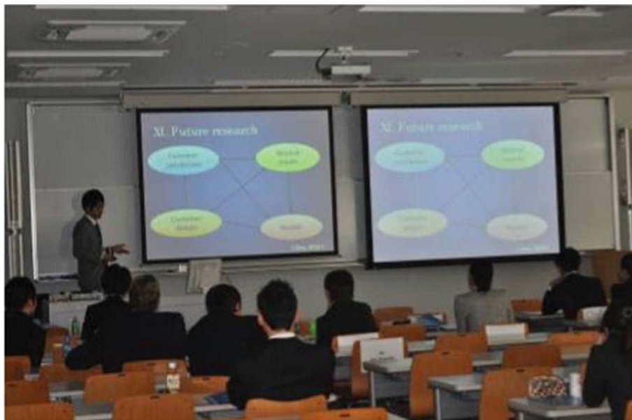
写真 2. シンポジストによる発表風景

トをはじめとして、早稲田大学グローバル COE プログラム登録学生から多くの質問があり、活発な討論の場となった(写真 2)。