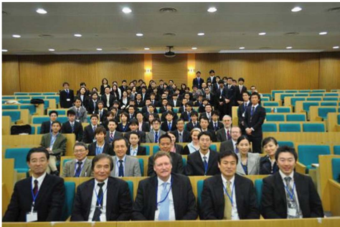
写真 1. 早稲田大学グローバル COE プログラム「アクティブ・ライフを創出するスポーツ科学」第 4 回国際シンポジウム終了後、招待講演者を囲んで記念撮影